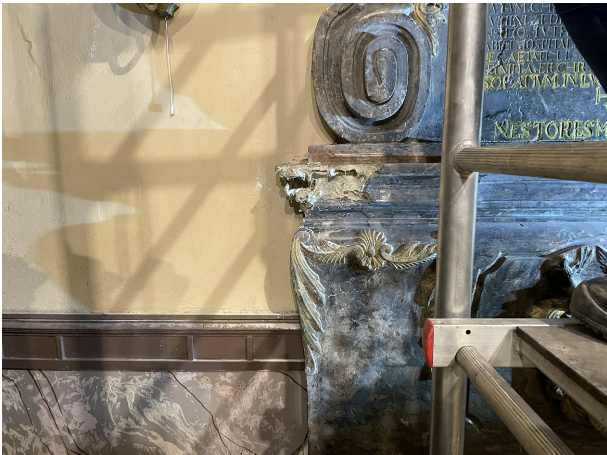
Hiányzó párkányelem pótlása

A konzolok fölötti durva felületi sérülésekkel érintett területekről polírozással kerültek eltüntetésre a korábbi, durva beavatkozások nyomai.