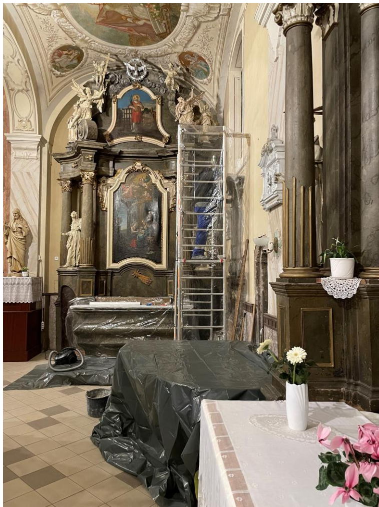
Állványozás, a munkaterület környezetének védelme

A restaurálás során mechanikus kézi tisztítással történt a szennyeződések eltávolítása, vegyszeres tisztítás nem került alkalmazásra. A restaurátori tervben megfogalmazott elveket figyelembe vette a kivitelező, mely szerint semmiképpen nem lehetett cél a felületi szennyeződések 100 %-os eltávolítása, hiszen ez már a kőanyag felületi roncsolódását is előidézi, így ezzel a „humánus” módszerrel megőrizhetők még az eredeti felületek minden apróbb eleme, vállalva, hogy a restaurálandó kőanyag felülete csekély százalékban szennyezett marad, ezzel elkerülve a visszafordíthatatlan „túltisztítást”. Különösen nagy figyelmet kellett fordítani a festett felületek tisztítására, törekedni kellett arra, hogy a festékréteg ne sérüljön.