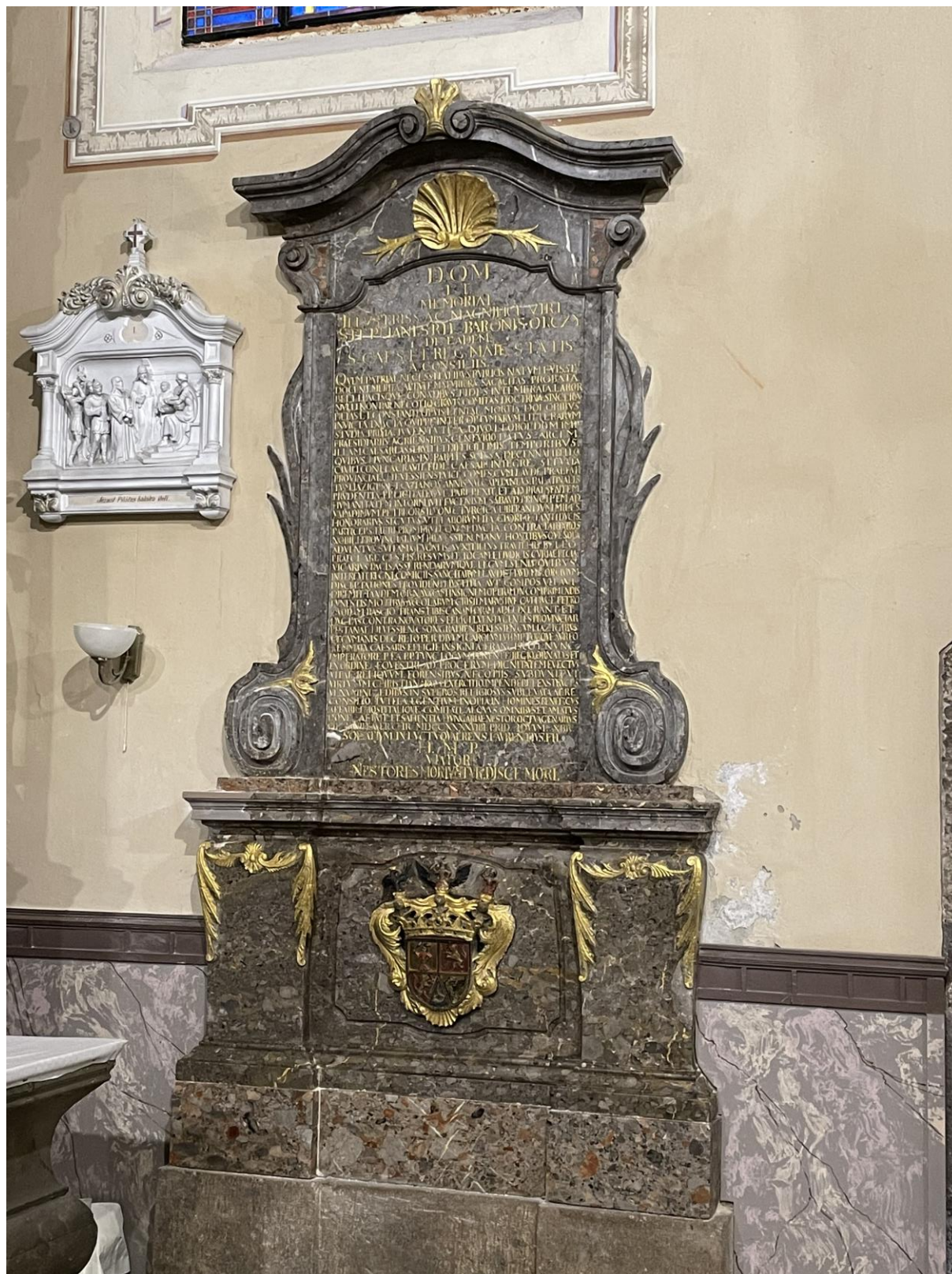
Restaurálás utáni állapot