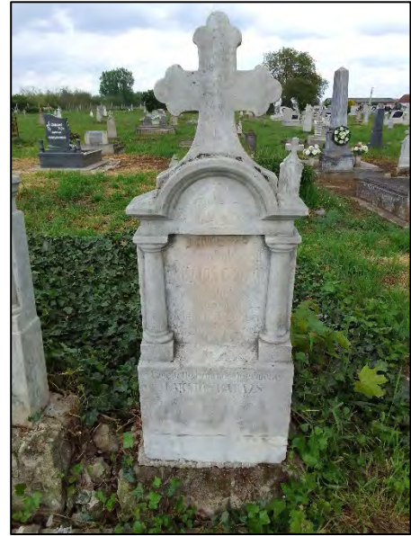
6. drótképezés, növényzet irtás