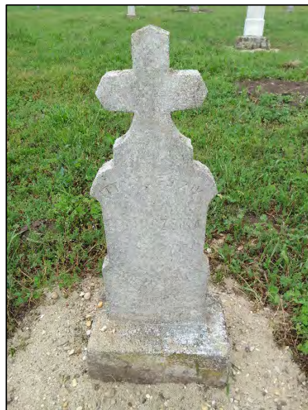
24. betonba öntés, drótkefzés