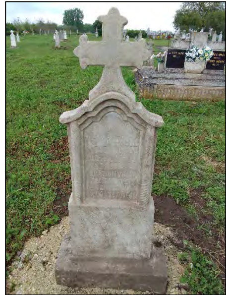
12. betonba öntés, drótkefzés