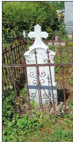
60. betonba öntés, drótkefzés