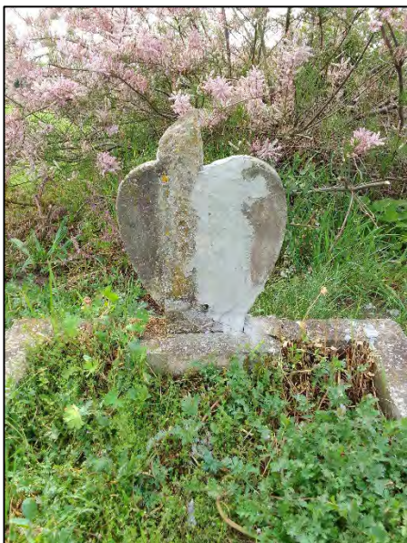
39. ragasztás, drótkefzés