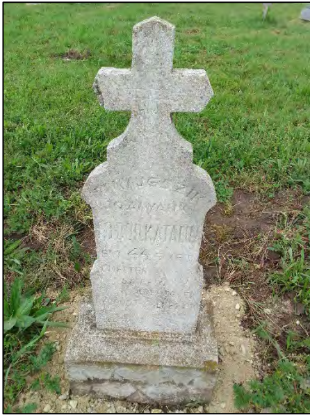
15. betonba öntés, drótkéfézés