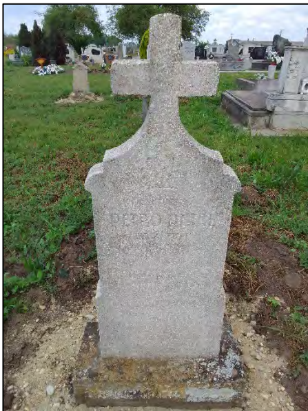
29. betonba öntés, drótkefézés