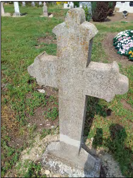
45. betonba öntés, ragasztás, drótkéfézés