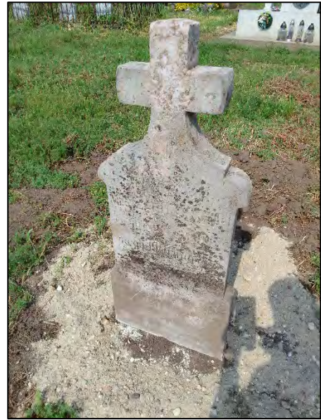
48. betonba öntés, drótkefzés