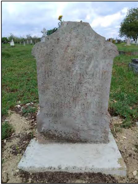
31. betonba öntés, drótkéfézés