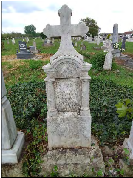
5. drótképezés, növényzet irtás