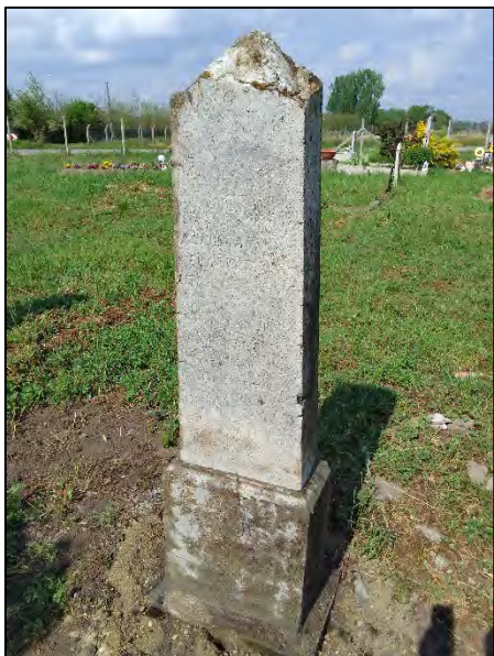
59. markolózás, betonba öntés, ragasztás, drótkefzés, sósavazás