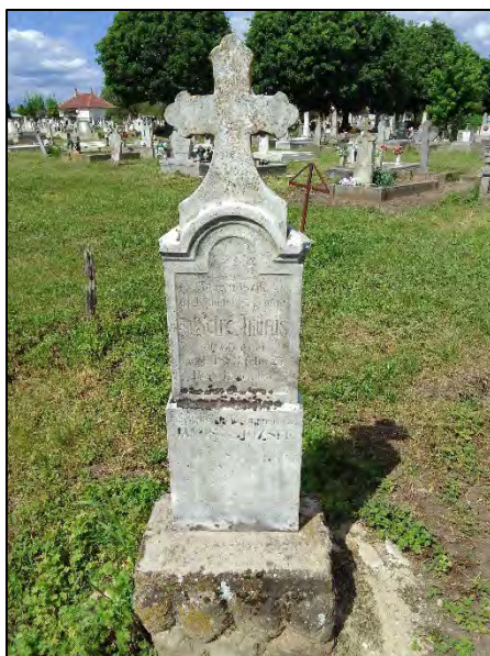
61. betonba öntés, drótkefzés