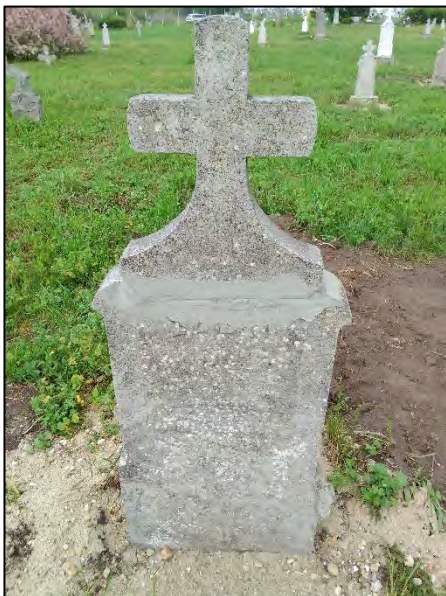
13. betonba öntés, ragasztás, drótkefzés