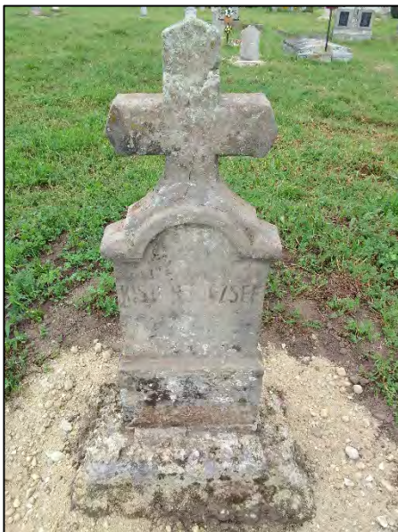
21. betonba öntés, drótkéfézés