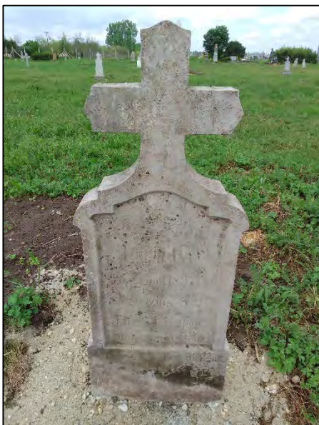
25. betonba öntés, drótkefzés