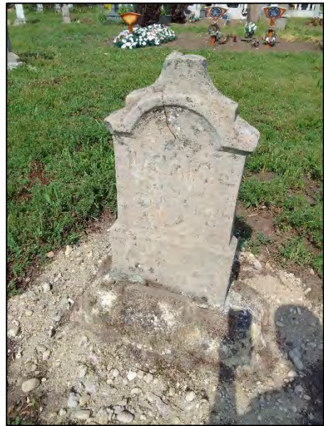
46. betonba öntés, drótkéfézés