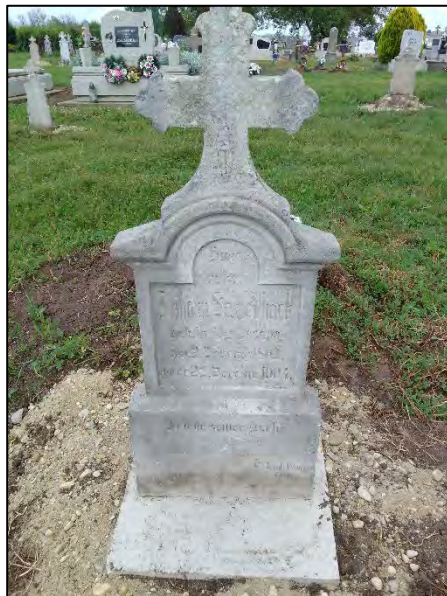
30. betonba öntés, drótkefézés