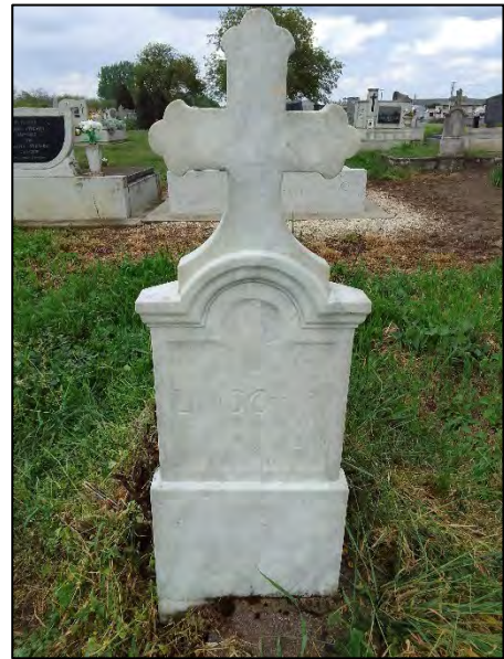
18. drótkéfézés, sósavazás