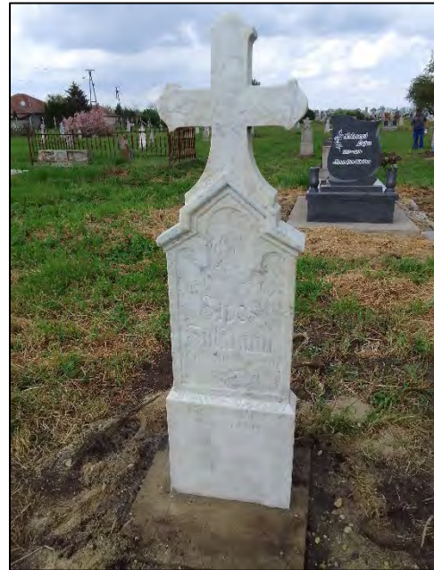
7. (előtte-utána) földben volt, betonba öntés, drótképezés, sósavazás