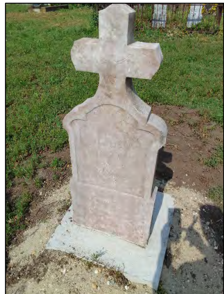
50. betonba öntés, drótkefzés