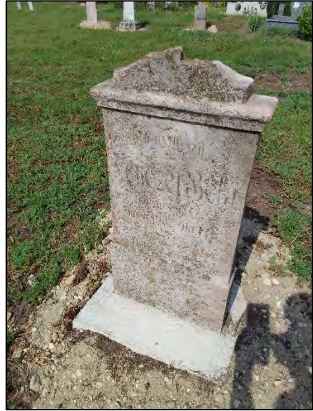
44. betonba öntés, drótkéfézés