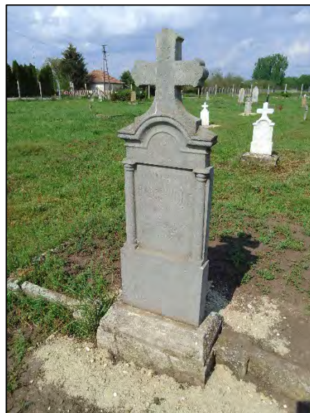
52. betonba öntés, drótkéfézés