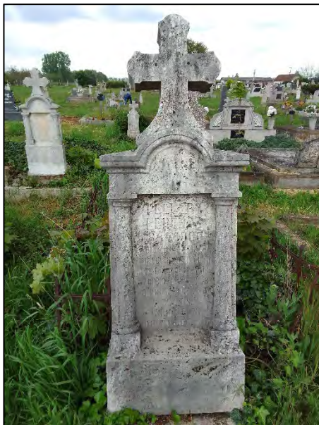
3. drótkézítés, növényzet irtás