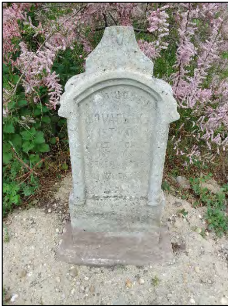
33. betonba öntés, drótkéfézés