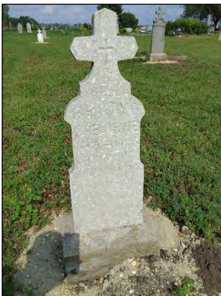
41. betonba öntés, drótkefzés