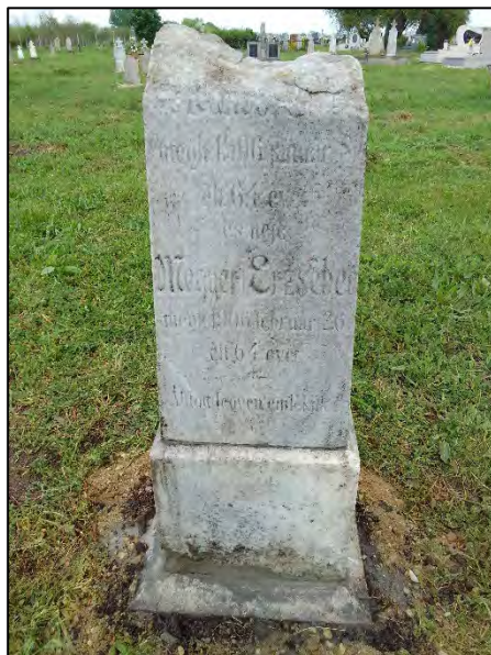
28. markolózás, betonba öntés, ragasztás, sósavavázás