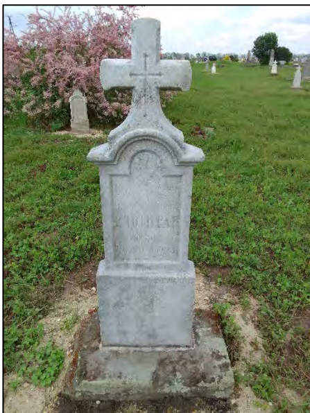
23. betonba öntés, drótkefzés, sósavazás