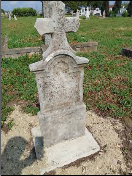
43. betonba öntés, drótkéfézés