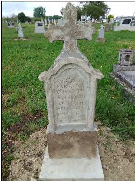
11. betonba öntés, ragasztás, drótkefzés