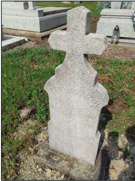
47. betonba öntés, drótkefzés