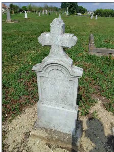
42. betonba öntés, drótkefzés, sósavazás