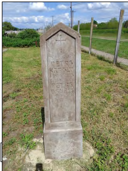
57. betonba öntés, drótkéfézés,