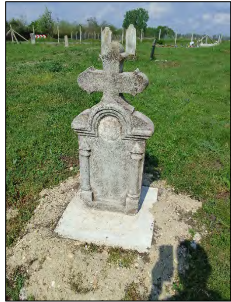
56. betonba öntés, drótkéfézés