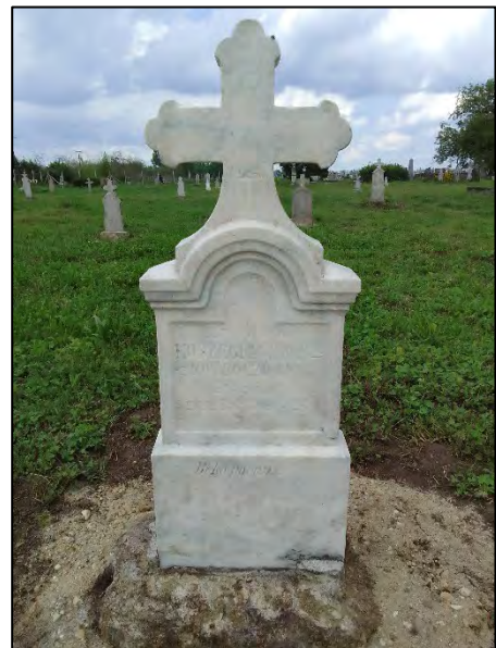
14. betonba öntés, drótkefzés, sósavazás