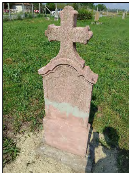
54. betonba öntés, ragasztás, drótkéfézés