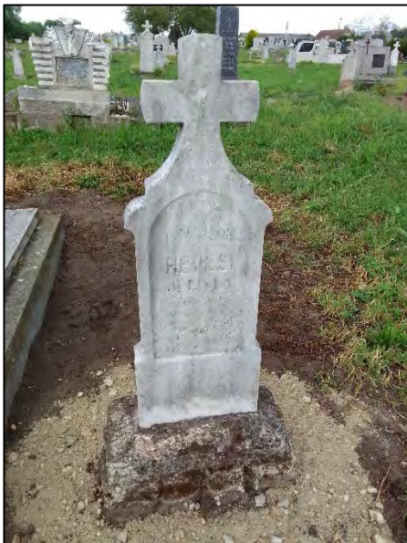
9. betonba öntés, drótkéfézés, sósavazás