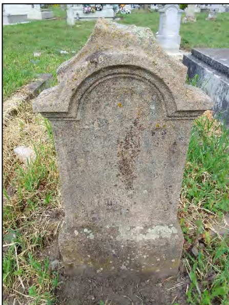
27. talpazat betonba rögzítése, drótkefézés