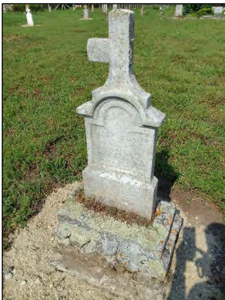
51. betonba öntés, drótkéfézés