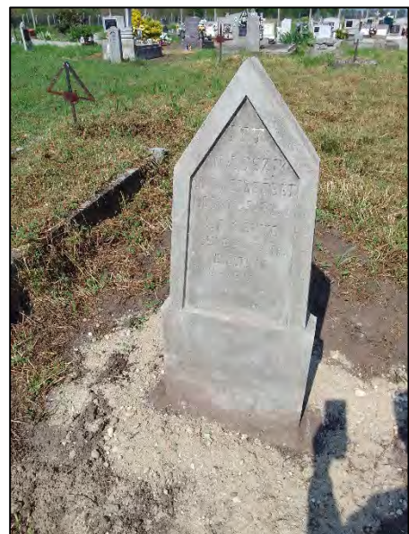
58. betonba öntés, drótkéfézés