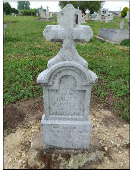
20. betonba öntés, drótkéfézés, sósavazás