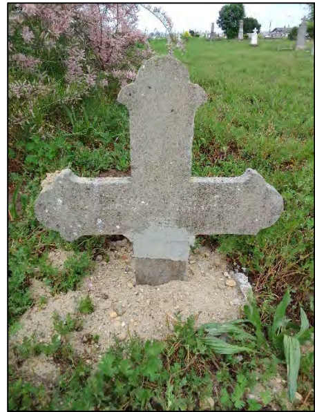
34. betonba öntés, ragasztás, drótkéfézés