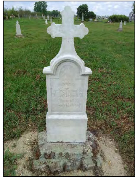
32. betonba öntés, drótkéfézés, sósavazás