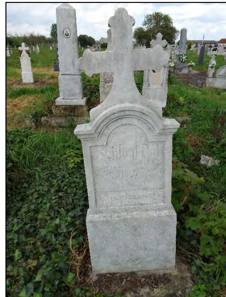
2. drótkézítés, sósavazás, növényzet irtás