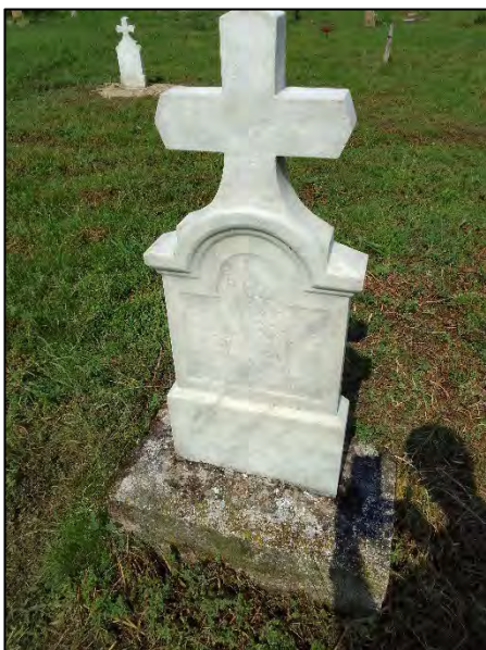
53. talapzat megigazítása, drótkéfézés, sósavazás