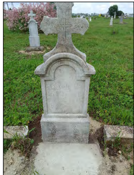
22. betonba öntés, drótkéfézés