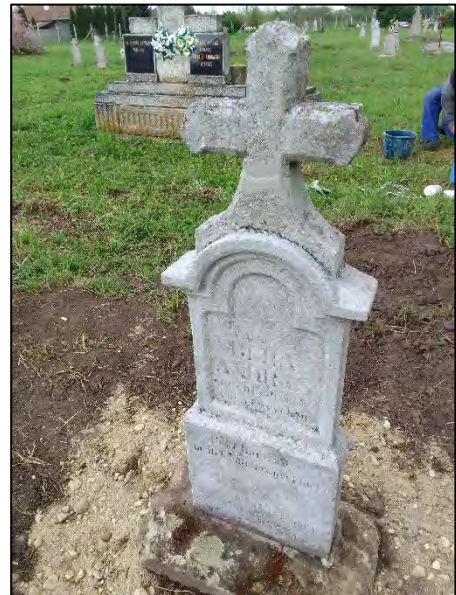
10. betonba öntés, kereszt ragasztása, drótkéfézés