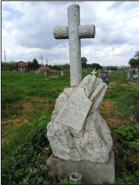
1. drótkézítés, növényzet irtás