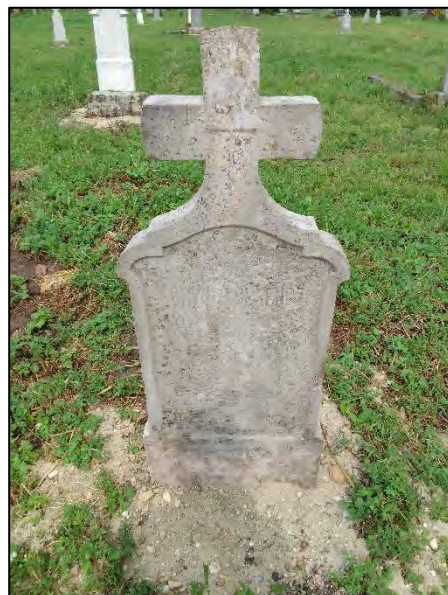
26. betonba öntés, drótkefzés