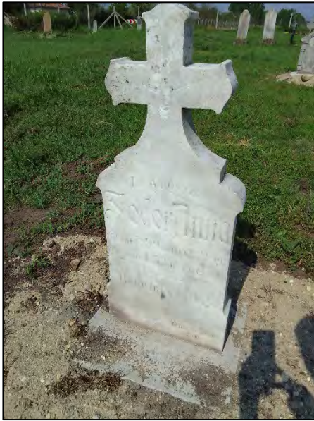
55. betonba öntés, drótkéfézés, sósavazás