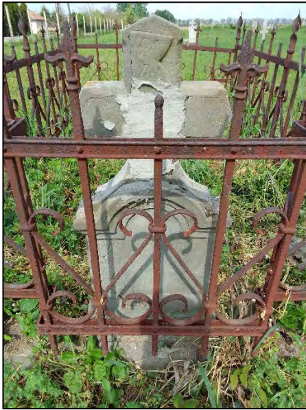
35. kereszt ragasztása, drótkefzés