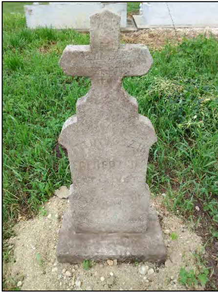
19. betonba öntés, drótkéfézés