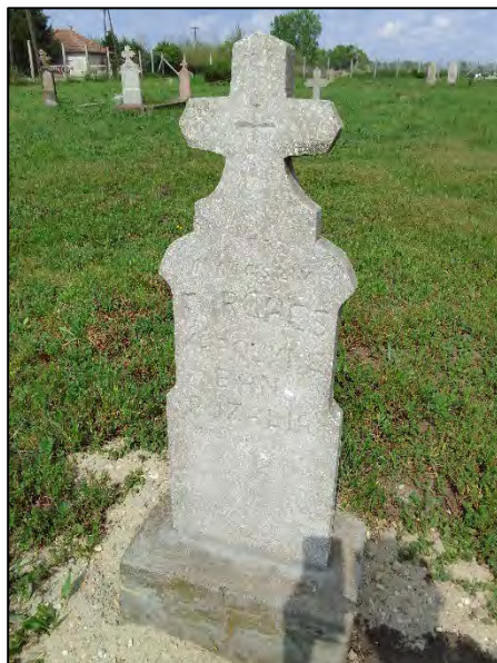
40. betonba öntés, drótkefzés