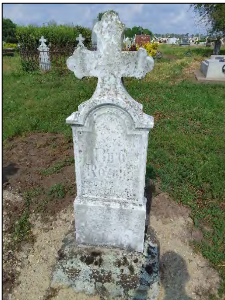
49. betonba öntés, drótkefzés