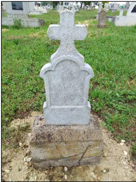
17. betonba öntés, drótkéfézés, sósavazás