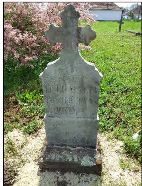
38. betonba öntés, drótkefzés